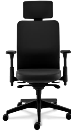
Modelo de Referência - Item 12 - Cadeira